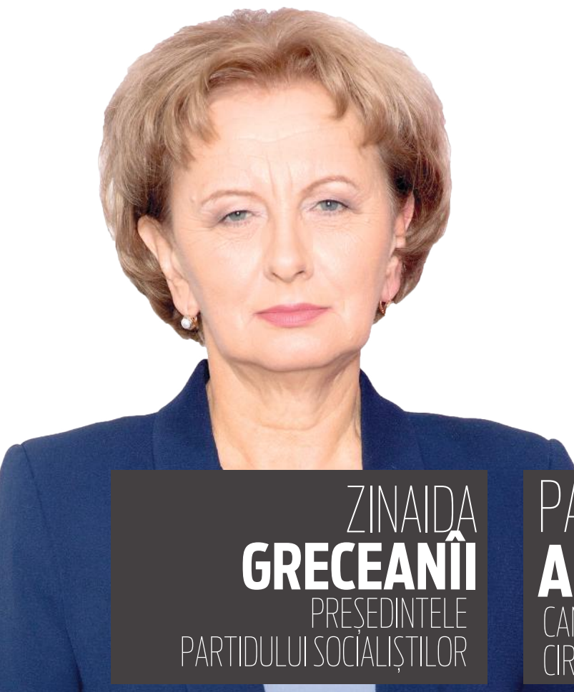
ZINAIDA GRECEANII PREȘEDINTELE PARTIDULUI SOCIALIȘTILOR