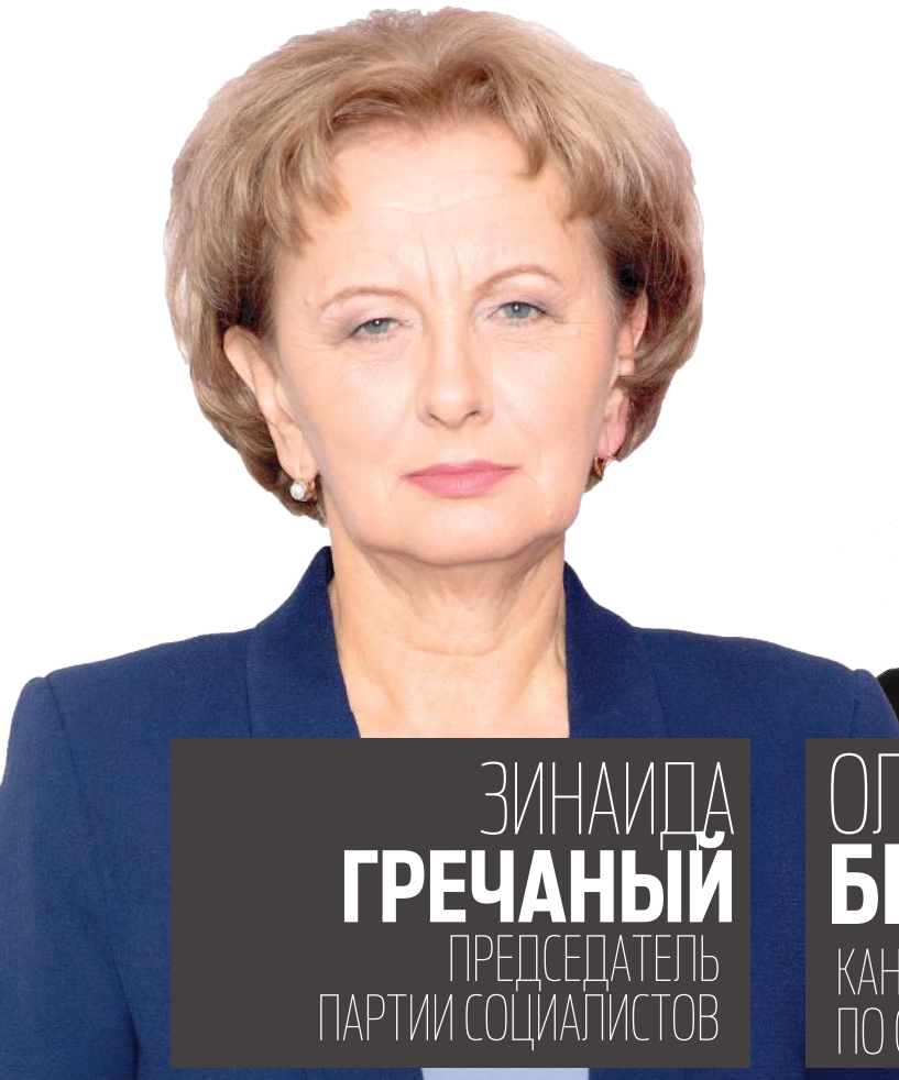
ЗИНАИДА ГРЕЧАНЫЙ ПРЕДСЕДАТЕЛЬ ПАРТИИ СОЦИАЛИСТОВ