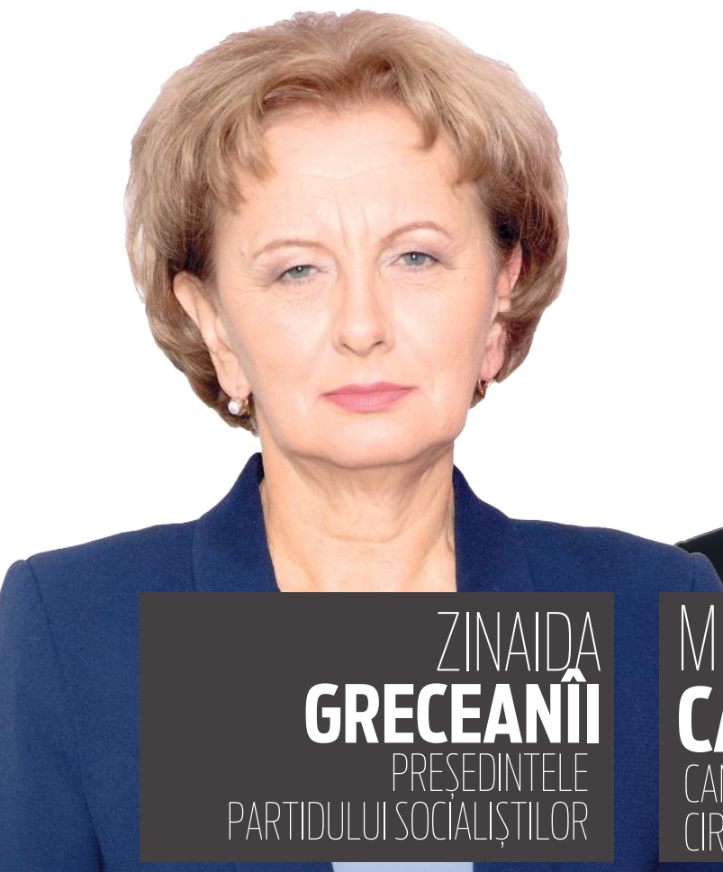
ZINAIDA GRECEANII PREȘEDINTELE PARTIDULUI SOCIALIȘTILOR