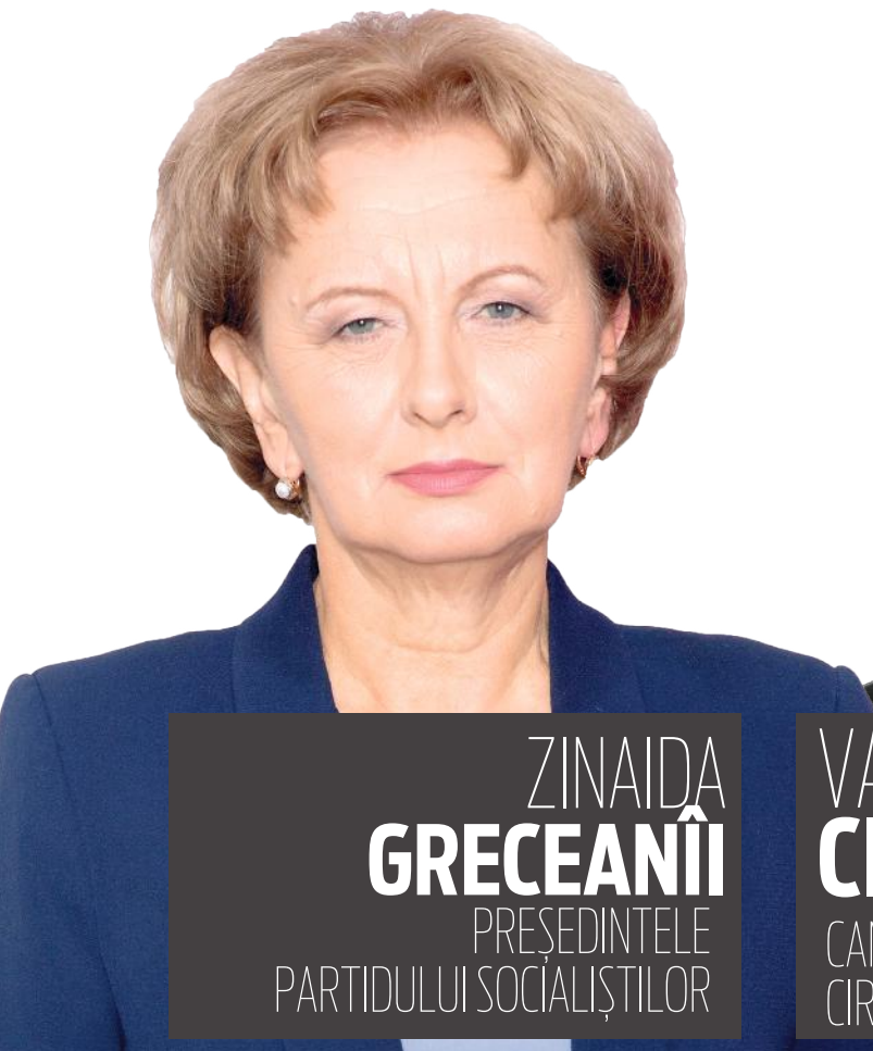
ZINAIDA GRECEANII PREȘEDINTELE PARTIDULUI SOCIALIȘTILOR