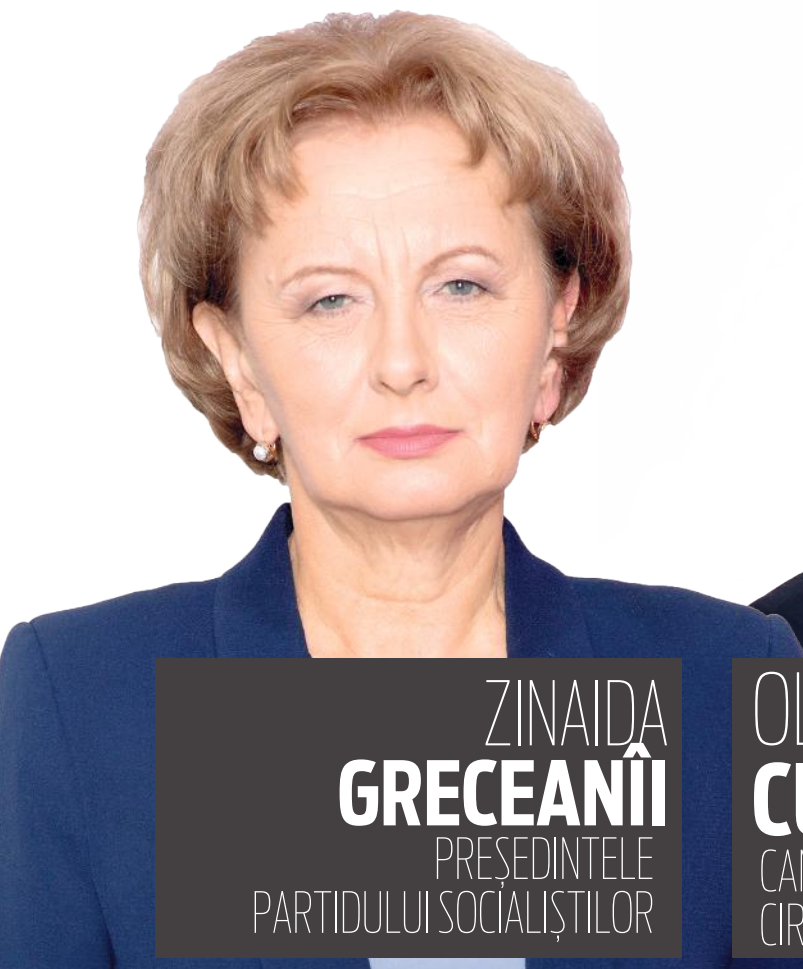
ZINAIDA GRECEANII PREȘEDINTELE PARTIDULUI SOCIALIȘTILOR