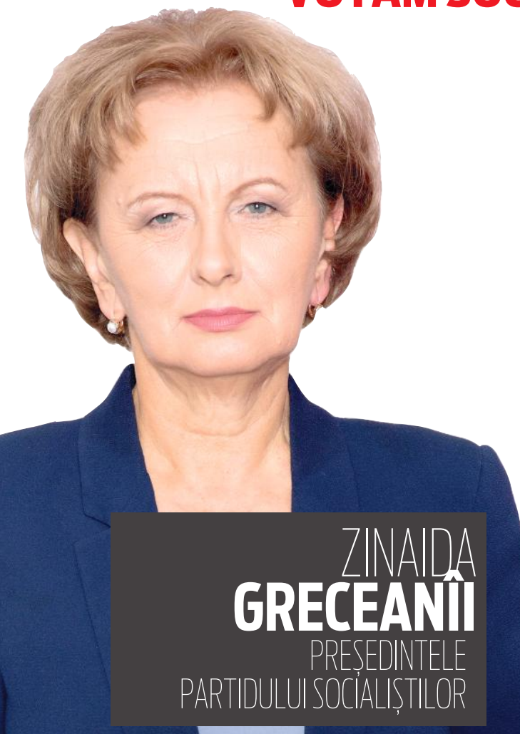
ZINAIDA GRECEANII PREȘEDINTELE PARTIDULUI SOCIALIȘTILOR