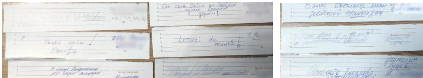
Изображение частично скрыто, согласно закону о защите персональных данных

Мы изучим каждое сообщение и приложим все силы для решения ваших проблем!