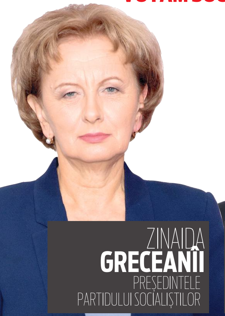
ZINAIDA GRECEANII PREȘEDINTELE PARTIDULUI SOCIALIȘTILOR