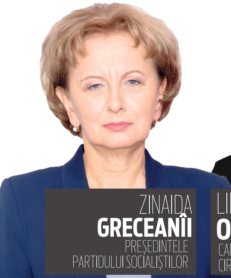
ZINAIDA GRECEANII PREȘEDINTELE PARTIDULUI SOCIALIȘTILOR