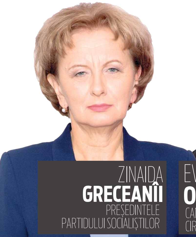
ZINAIDA GRECEANII PREȘEDINTELE PARTIDULUI SOCIALIȘTILOR