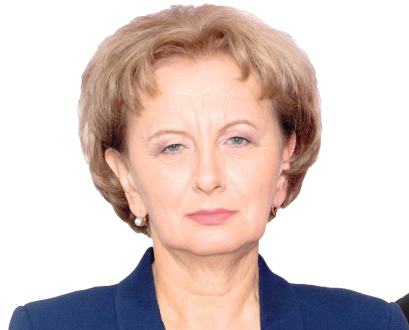
ЗИНАИДА ГРЕЧАНЫЙ ПРЕДСЕДАТЕЛЬ ПАРТИИ СОЦИАЛИСТОВ