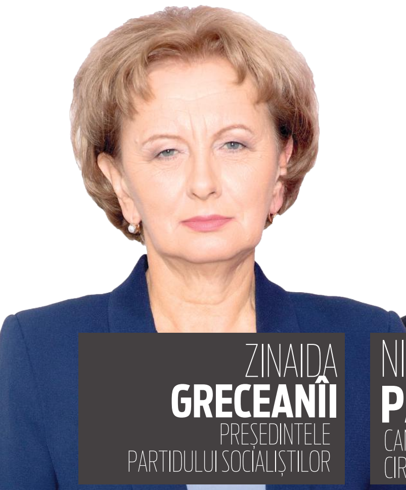
ZINAIDA GRECEANII PREȘEDINTELE PARTIDULUI SOCIALIȘTILOR

Ialoveni Căușeni, Hîncești VOTĂM SOCIALIȘTII. E LOGIC.